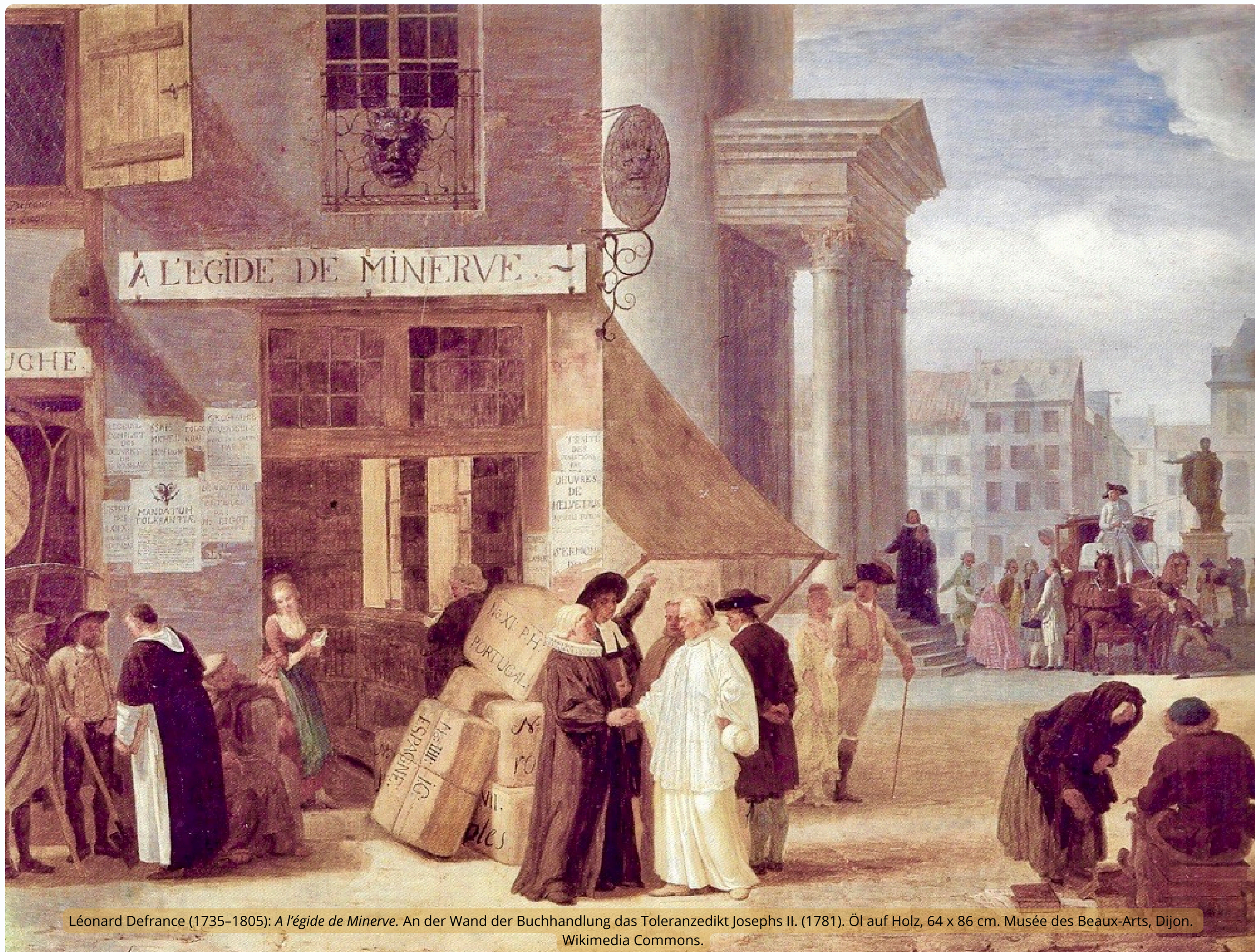
Léonard Defrance (1735–1805): A l'égide de Minerve . An der Wand der Buchhandlung das Toleranzedikt Josephs II. (1781). Öl auf Holz, 64 x 86 cm. Musée des Beaux-Arts, Dijon. Wikimedia Commons.